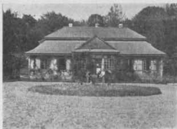
Schronisko P. T. K. nad Świteziją.

Inną ważną pracą Redakcji było ustalenie granic gromad wiejskich, które w znacznym stopniu nie pokrywają się z granicami dawnych gmin wiejskich i obszarów dworskich. W tym celu ustalono w Biurze Redakcyjnym, dla których gromad (na skutek zmian granic przy przejściu od dawnych gmin wiejskich do nowego ustroju) Redakcja posiadała informacje wątpliwe, wymagające skontrolowania i uzupełnienia w terenie. Gromad takich było 579 na ogólną liczbę 1442, czyli 40%. Szczególnie duża ilość przypadła na północno-zachodnie powiaty Pomorza. Sprawa ta nasuwała specjalne trudności ze względu na to, że prace nad ostatecznym ustaleniem granic gromad