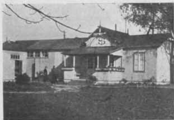
Przystanek Sekcji Turystyki Wodnej Oddziału Warszawskiego P. T. K. w Warszawie.

Według sprawozdań nadesłanych i ostatnich danych (X.1936) ewidencji Zarządu Głównego w województwach poszczególnych czynne były Oddziały następujące: (I). w woj. Białostockim: (1) Białystok (79 czł.), (2) Grodno (20 czł.), (3) Suwałki (67 czł.), (4) Wolkowsk (24 czł.).