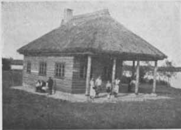
Schronisko P. T. K. na Ostrowiu Lednickim.

Zarząd Główny, czyniąc zadość propozycji Zarządu Oddziału Warszawskiego, przekazał w myśl § 26 Statutu Zarządowi Oddziału Warszawskiego w administrację lokal Stowarzyszenia, zbiory, jako to: bibliotekę, przezroczą, zbiory fotograficzne, wydawnictwa własne i komisowe oraz Główne Biuro P. T. K. z Dyrektorem Biura na czele, powoływany przez Prezesa Oddziału Warszawskiego za zgodą Prezydium Zarządu Głównego, oraz personelem, zależnym od Dyrektora Biura i Zarządu Oddziału Warszawskiego.