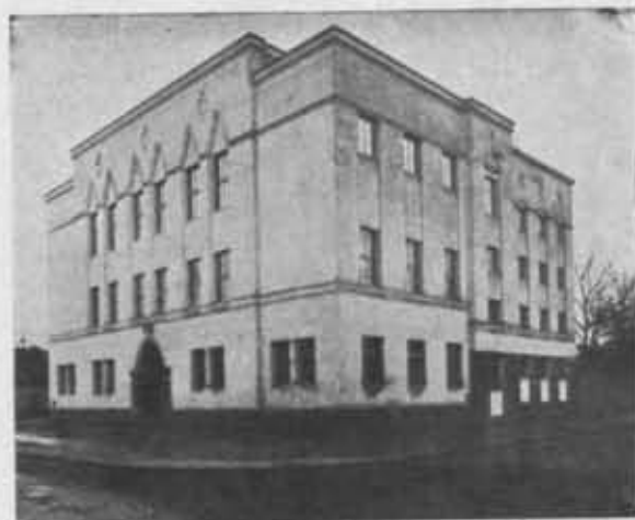
Dom P. T. K. we Włocławku.

Domy P. T. K. Stan posiadania P. T. K. w stosunku do r. poprzedniego nie uległ zmianie w roku sprawozdawczym; dwa nowe domy (schroniska) znajdują się na wykończeniu (nad Wigrami i nad jeziorem Lednickim). Stan posiadania nieruchomości P. T. K. wyrażałby się przeto liczbą 10 domów własnych, z których 6 zajętych jest pod schroniska wycieczkowe, 3 pod muzea i 1 pod przystań turystyki wodnej w Warszawie. Schroniska: w Toruniu (48.953.75), nad Świtęzią (21.999), nad Wigrami (2 — wraz ze znajdującym się