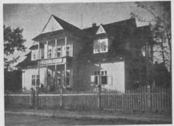
Dom Wycieczkowy P. T. K. im. ks. Stolarczyka w Zakopanem.

III. Komisja Porozumiewawcza P. T. K. z Polskim Towarzystwem Tatrzańskim pracowała dalej w składzie następującym: ze strony P. T. K. wchodził do niej pp.: