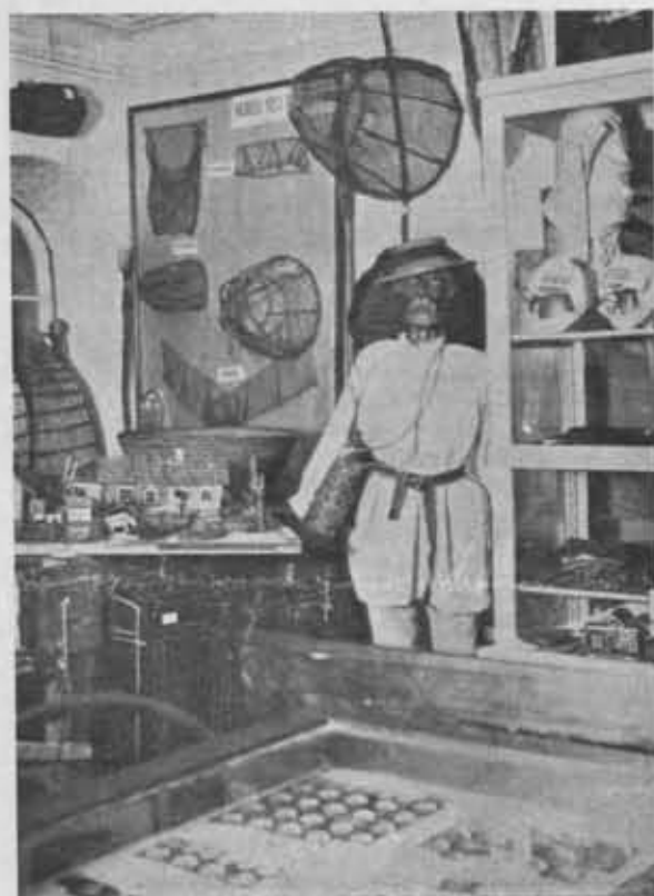
Fragment z Muzeum Poleskiego P. T. K. w Pińsku.

3 kajaki i przystań własną. Oddział w Bydgoszczy posiada 28 kajaków, zorganizował 10 wycieczek (1090 km), Oddział w Kostopolu posiada przystań wydzierżawioną, ilość członków 23, Oddział we Lwowie posiada również przystań wydzierżawioną na stawie Melczyckim, zorganizował 26 wycieczek (2850 km), posiada 5 kajaków dwuosobowych — ilość członków 18, Oddział w Łucku (korzysta z 29 stanic żeglarskich Urzędu Woj.), Oddział w Suwałkach (brak bliższych danych), wreszcie Oddział Warszawski posiada przystań własną o przeszło 100 kajakach: wycieczek odbyto 138, wyjazdów z przystani było 771, przyjęto członków 2.239, gości 440.