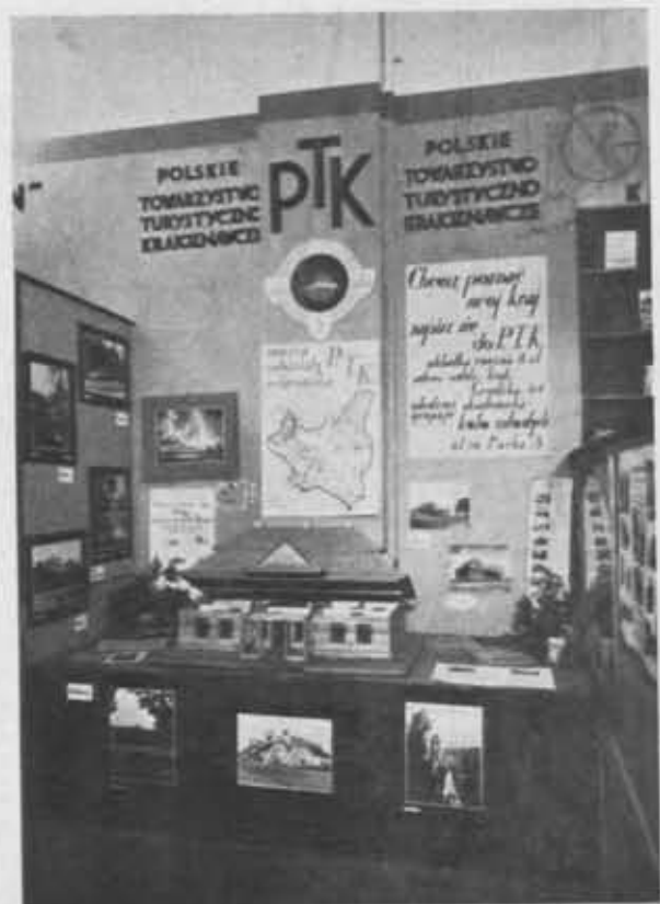
Stoisko P. T. K. na Wystawie Sportowo-Turystycznej w Krakowie (październik 1935 r.)

Propaganda rodzimego obyczaju. Zagadnienie to niezmiernie trudne i skomplikowane nie jest jeszcze w Oddziałach P. T. K. należyte rozwinięte. Znac-