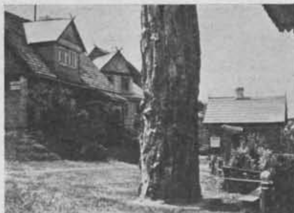
Regionalne Muzeum Kurpiowsko-Nadnarwiańskie P. T. K. w Nowogrodzie Łomżyńskim.

w budowie — 45.000), w Pucku (25.000), w Zakopanem (160.250) i w Sandomierzu, którego wartość łącznie z domem muzealnym wynosi 47.174,40; domy pod muzea: w Nowogrodzie Łomżyńskim (17.616) i we Włocławku (301.609,12) oraz zabudowania przystani sekcji turystyki wodnej w Warszawie (19.000). Wartość zatem nieruchomości P. T. K. zamyka się bez mała kwotą 700.000 zł.