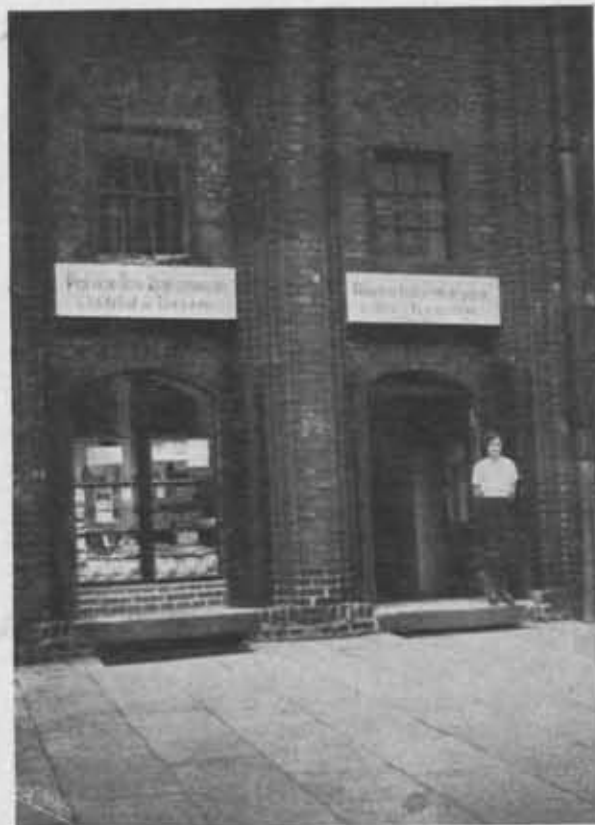
Biuro informacyjne dla turystów Oddziału P. T. K. w Toruniu (w gmachu ratusza Toruńskiego)