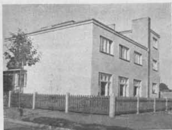
Dom i schronisko P. T. K. w Toruniu.

(VIII). w wojew. Pojeńskim: (1) Brześć n. Bugiem (30 czł.), (2) Pińsk (41 czł.).