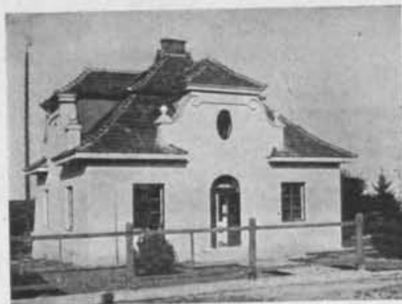
Muzeum P. T. K. w Sandomierzu.

(XV). w woj. Wileńskim: (1) Brasław (24 czł.), (2) Głębokie (41 czł.), (3) Wilno (63 czł.).