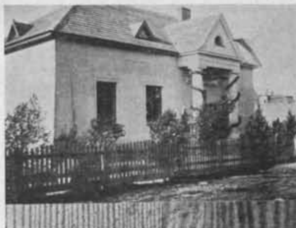
Schronisko P. T. K. w Pucku.

Ostatnio (29.V.36) zorganizowany został Oddział w Kobryniu.