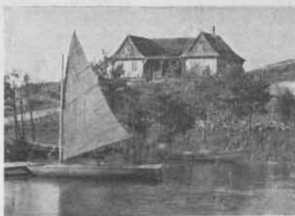
Schronisko P. T. K. nad jeziorem Wigierskim.

Stan organizacyjny P. T. K. Na 70 zarejestrowanych Oddziałów w roku 1935 nadesłało sprawozdania ze swej działalności, przeważnie na formularzach rozesłanych przez Zarząd Główny, 58 Oddziałów, przy czym jednak nie wszystkie Oddziały z wymienionej liczby nadesłały sprawozdania przed dorocznym Zjazdem