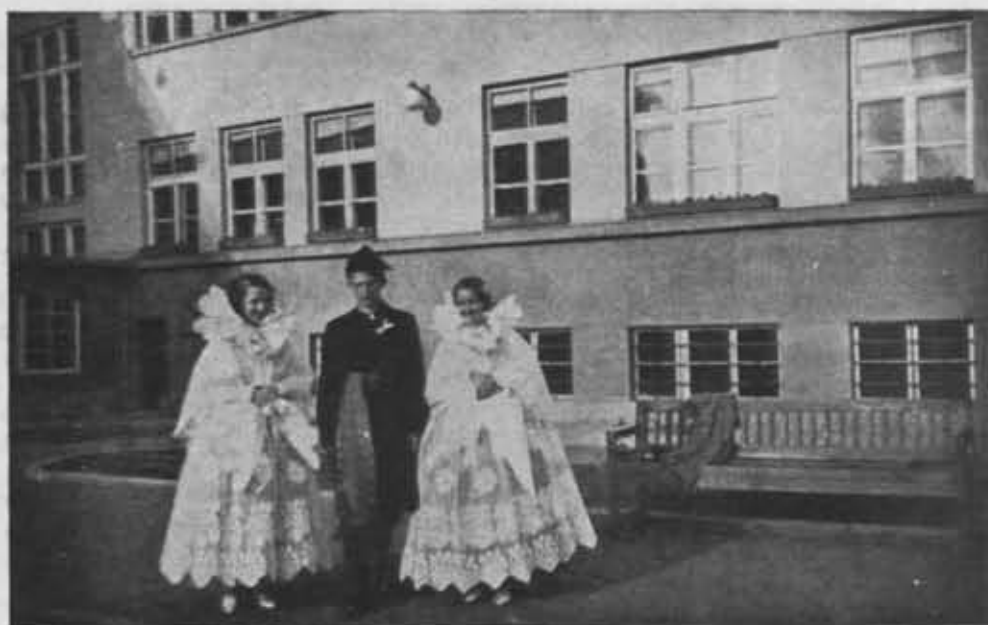
Delegacja Koła Krajoznawczego Młodzieży Szkolnej z Żywca na jubileuszu P. T. K. 24.V.1936 w Krakowie.

w woj. wołyńskim o nakładzie 2000 egz. i opracowano dla użytku turystów mapkę szlaków turystycznych w skali 1:1.000.000.