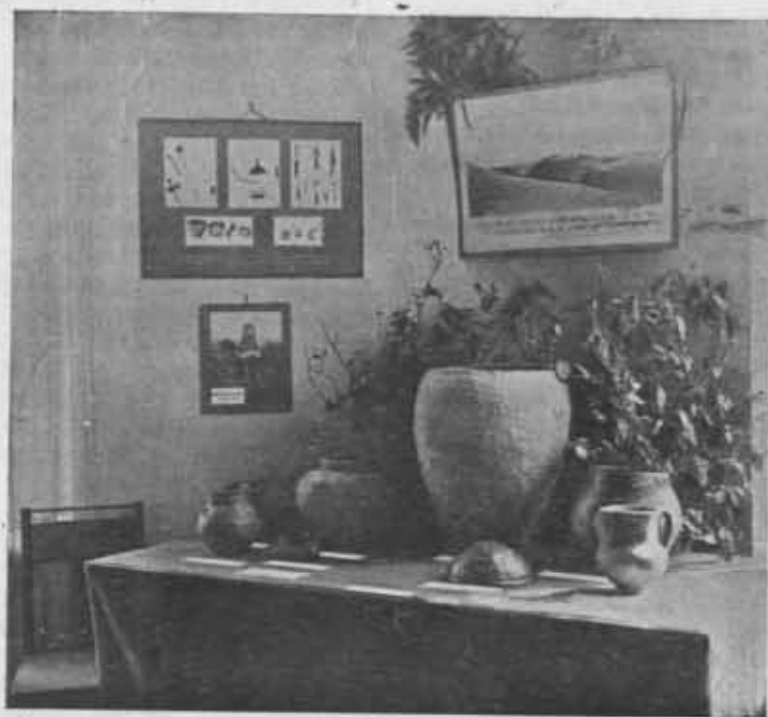
Fragment z działu prehistorycznego Wystawy Świętokrzyskiej P. T. K. w Warszawie i w Kielcach 1936, urządzonego przez Państw. Muzeum Archeologiczne w Warszawie.

Ochrona zabytków kultury prowadzona była przez Oddziały: 1. w Białymstoku, który interweniował w sprawie ochrony kopców i grodzisk w pow. bielskim, sokólskim i białostockim, 2. w Głębokiem — zarejestrował, opisał i odfotografował 80 kurhanów, 3. w Gnieźnie opiekował się ruinami zam-