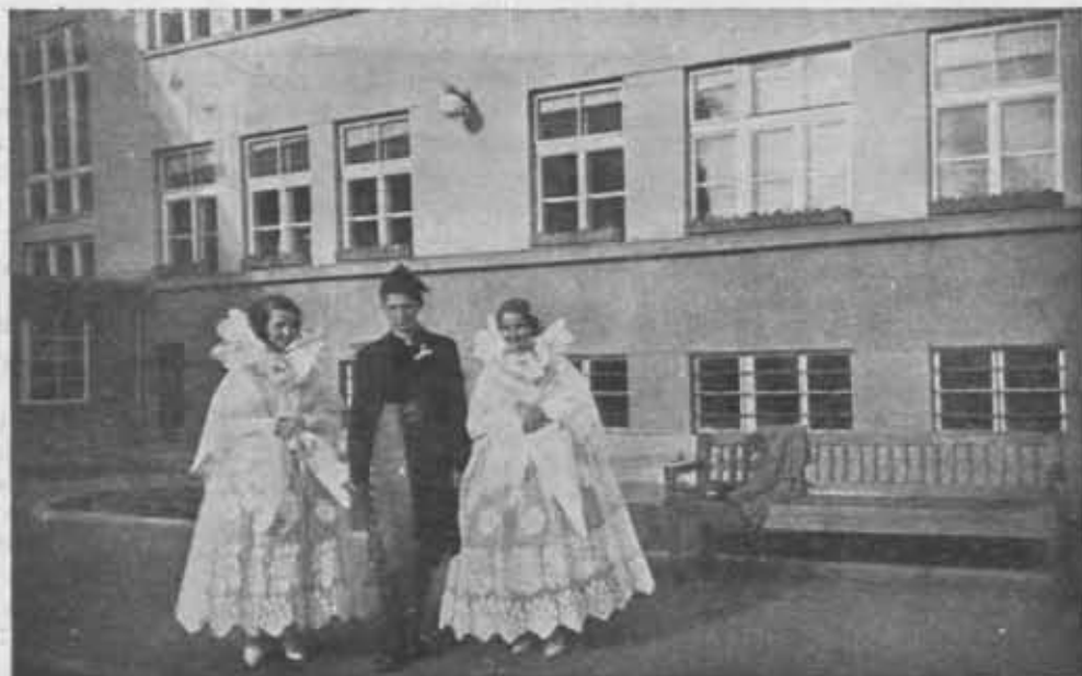
Delegacja Koła Krajoznawczego Młodzieży Szkolnej z Żywca na jubileuszu P. T. K. 24.V.1936 w Krakowie.

W ciągu roku sprawozdawczego przybyły, względnie wznowiły działalność Oddziały następujące: 1. Drohiczyn Poleski (nowy), 2. Kazimierz nad Wisłą (grudzień 1936 — wznowiony), 3. Kobryń (maj