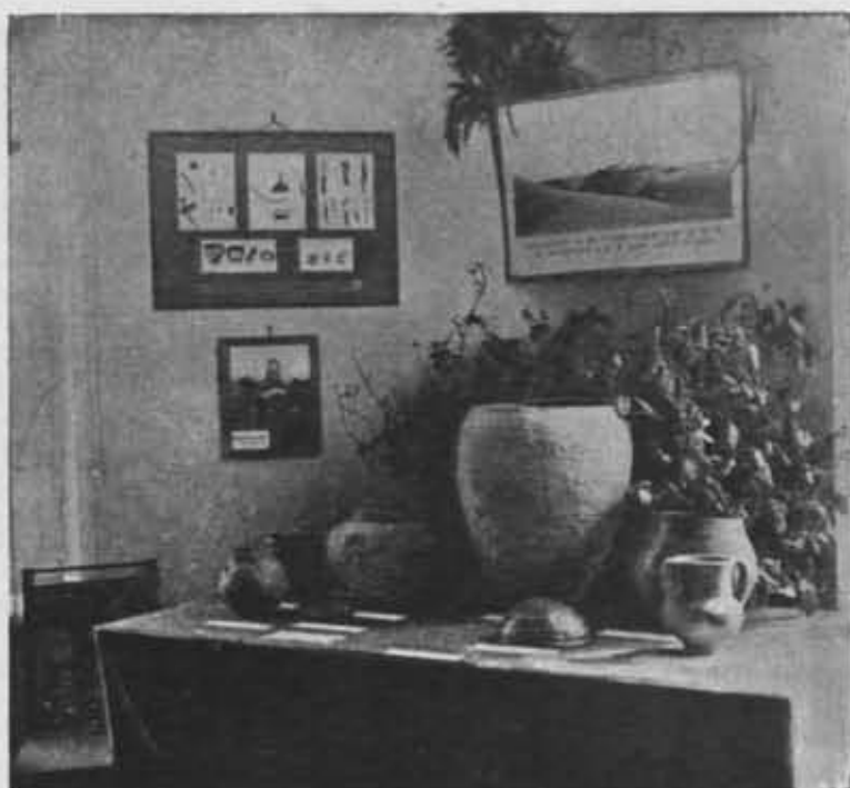
Fragment z działu prehistorycznego Wystawy Świętokrzyskiej P. T. K. w Warszawie i w Kielcach 1936, urządzonego przez Państw. Muzeum Archeologiczne w Warszawie.

n. Bugiem (40 czł.), (3) Kobryń (10 czł. Oddział w stadium organizacyjnym), (4) Pińsk (122 czł.) — z Kołem w Kosowie Poleskim, Delegaturami: w Dawidgródku, Lubieszowie, Lunińcu, Prużanie i Stolinie. Akcja organizacyjna Oddziału Pińskiego, działającego jednocześnie w roli zarządu Okręgu Poleskiego wpłynęła na wzrost członków. Oddział w Pińsku w r. 1935 liczył członków 41, w 1936 ma ich 122.