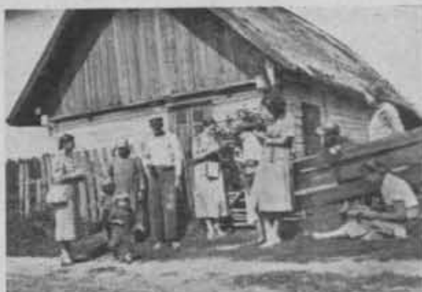
Wywiad Krajoznawczy, prowadzony przez naszą młodzież.