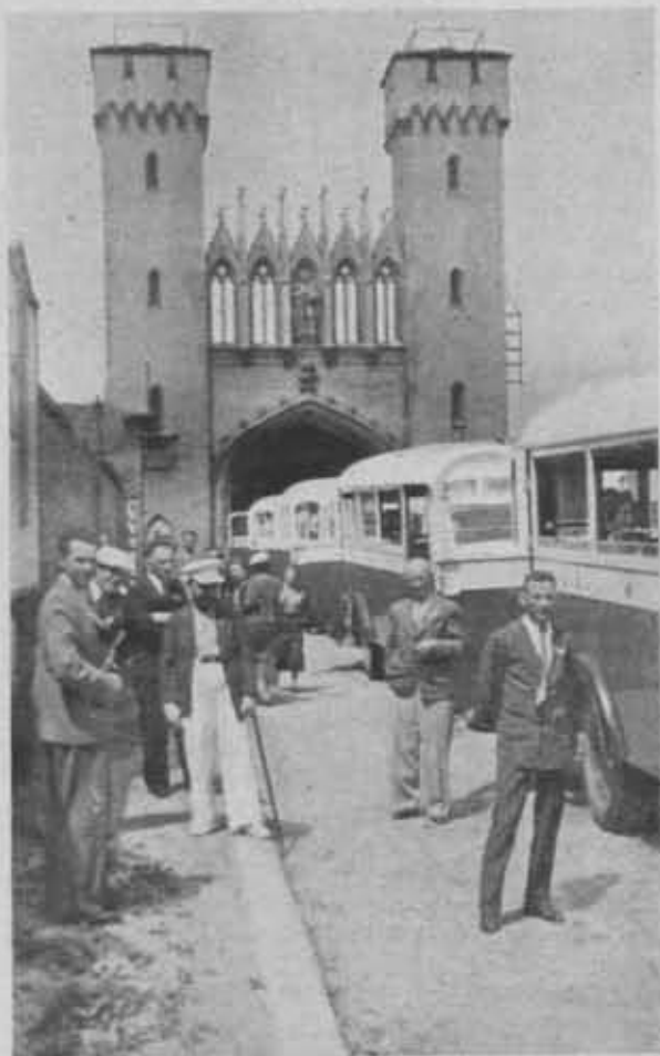
Wycieczka Oddz. Morskiego PTK do Malborka i Elbląga. — Na granicy Gdańsko-Niemieckiej koło Malborka.