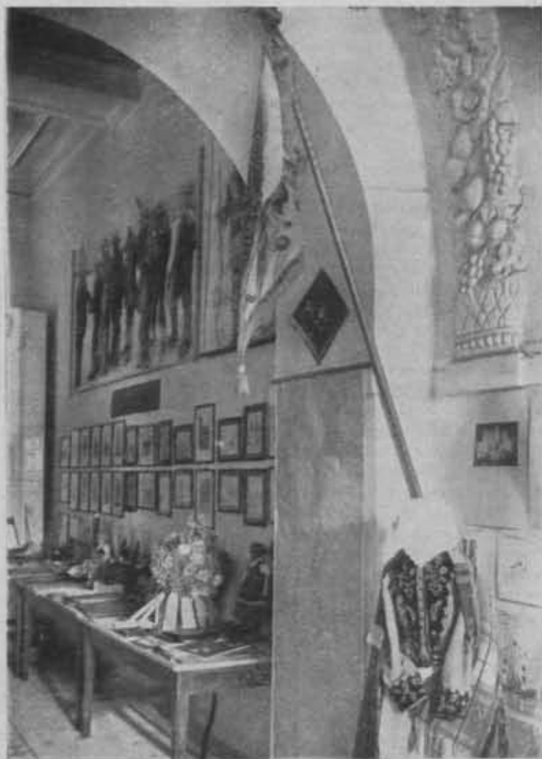
Fragment Wystawy Prac Młodzieży w Pałacu pod Baranami w Krakowie.

śna komisja muzealna pracuje intensywnie, realizując stopniowo opracowany plan działania, Oddział w Radomiu — powołał komisję do spraw Zanku Szydłowieckiego, Oddział w Łwowie — szkoli przewodników, zorganizował dla nich kurs, podobnie, jak to czyni co roku. Kurs wysłuchał 41 wykładów, odbył w ra-