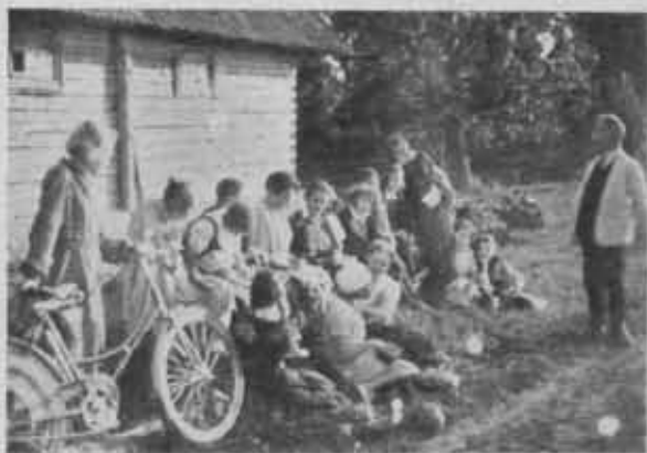
Z wycieczki Koła Krajoznawczego gimn. E. Orzeszkowej w Wilnie, Bukiszki, Szkoła Rolnicza.

Jednoczą działania Kół również instruktorzy, tj. członkowie Kół, którzy otrzymali stopień instruktorski na obozach instruktorskich Kół krajoznawczych; w Wilnie mamy instruktorów 4.