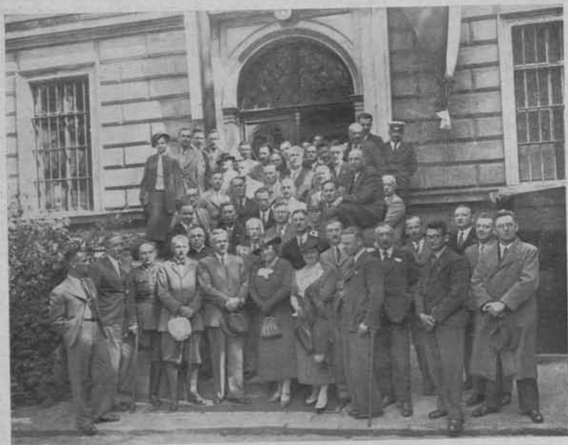
31 zjazd Delegatów PTK w Bydgoszczy (22 — 23. V, 1937).

KALENDARZOWY rok 1937, w działalności Polskiego Towarzystwa Krajoznawczego trzydziesty pierwszy zaznaczył się dalszym rozwojem liczbowym Towarzystwa. Zwiększyła się bowiem liczba Oddziałów P. T. K. oraz w znaczny sposób i liczba członków.