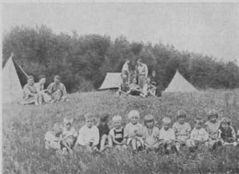
Campingi Sekcji wodno-turystycznej odwiedzają miejscowi mieszkańcy, chętnie gawędząc i słuchając o nowościach z miasta, a ich latorośle zjadają smakołyki ofiarowane przez kajakowców. (Bydgoszcz).

Sport wodny uprawiany jest na wysokim poziomie w sekcji turystyki wodnej Oddziału War-