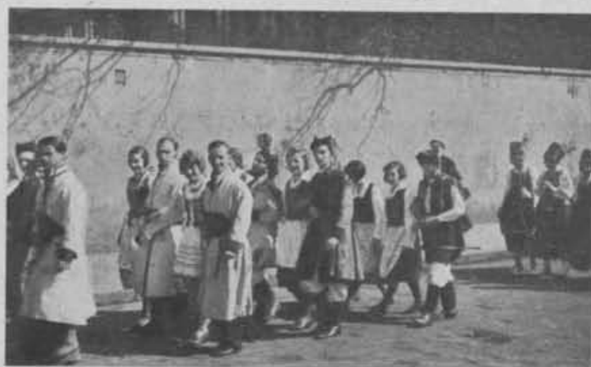
Młodzież krajoznawcza P. T. K. propaguje przy każdej okazji stroje regionalne.

Dzięki tym okolicznościom Zarząd Główny zdolał w roku 1938 uregulować poważne zobowiązania z lat ubiegłych, zmniejszyć w znacznym stopniu za-