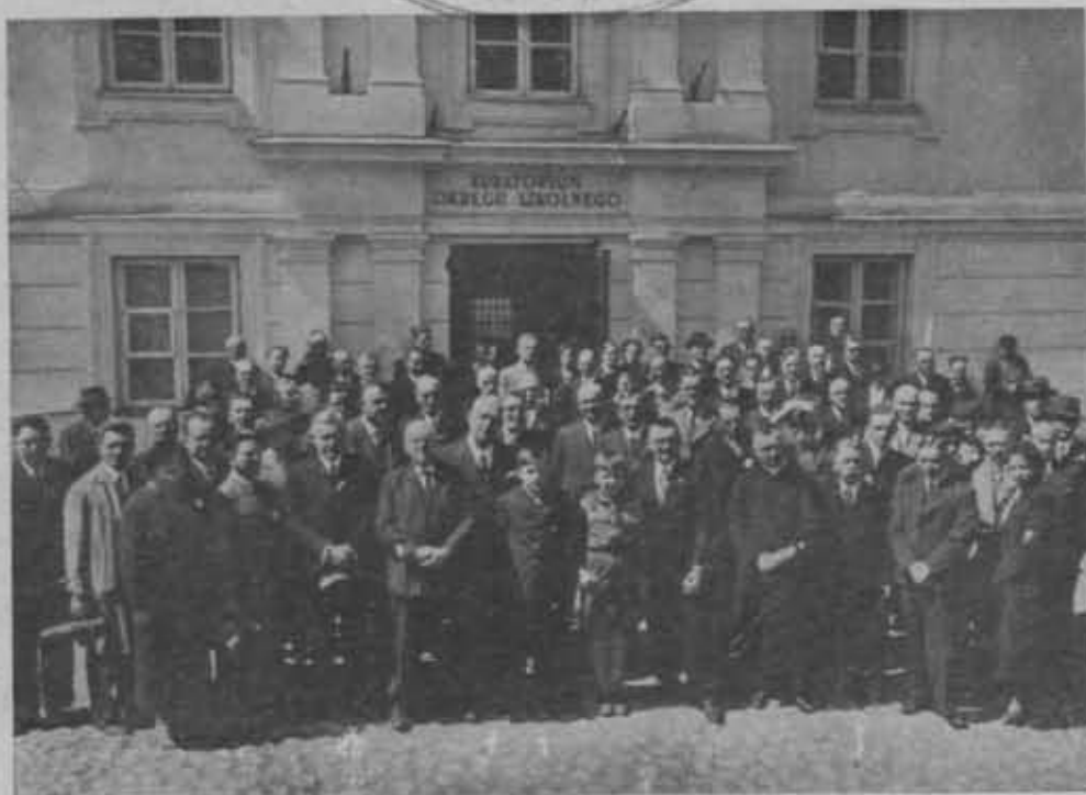
Grupa uczestników Zjazdu Delegatów P. T. K. w Wilnie (15 maja 1938 r.).

Naprzężona sytuacja polityczna 1938 roku nie sprzyjała normalnym pracom Polskiego Towarzystwa Krajoznawczego. Nie wszystkie zamierzenia, przewidziane w planie pracy, mogły być zrealizowane, nie wszystkie poczynania dały oczekiwane rezultaty. Jeżeli mimo tych warunków komórki organizacyjne PTR wykazały pokaźne wyniki swych prac, jeżeli na pewnych odcinkach naszej pracy odnieśliśmy nawet sukcesy, świadczy to, iż idea, na której Polskie Towarzystwo Krajoznawcze opiera swe prace, jest zawsze żywotna, a prace nasze są koniecznym elementem życia państwowo - społecznego. Fakt, że doroczny Zjazd Delegatów Oddziałów PTR odbywamy w roku 1939 na Śląsku Zaolziańskim, stanowiącym dziś integralną część Rzeczypospolitej Polskiej, ma swoją radosną wymowę. Fakt ten napawa nas wiarą we własne siły i granitową trwałość kultury polskiej, dla której dobro pracuje z oddaniem Polskie Towarzystwo Krajoznawcze.