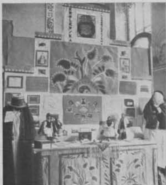
Fragment Wystawy Kół Krajoznawczych z okazji Zjazdu Kół we Lwowie — maj, 1938.