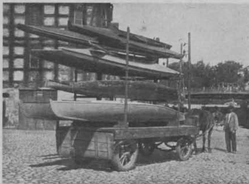
Staraniem sekcji wodno-turystycznej P. T. K. w Bydgoszczy uruchomiono dla wygody kajakowców specjalne wozy dla przewożenia kajaków na dworzec.

Komisja Turystyczna opracowuje obecnie instrukcję w sprawie znormalizowania typu wydawnictw przewodnikowych P. T. K. Zarząd Główny dąży bowiem do tego, aby wszystkie wydawnictwa przewodnikowe P. T. K. posiadały jednolity format.