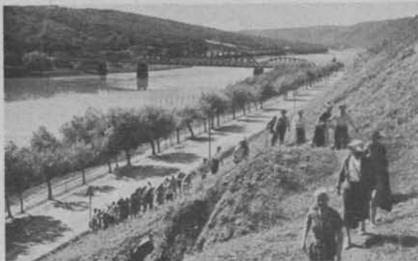
Wycieczka podgórska Oddziału Poznańskiego PTK.

Oddział w Suwałkach posiada zaczątki zbiorów muzealnych.