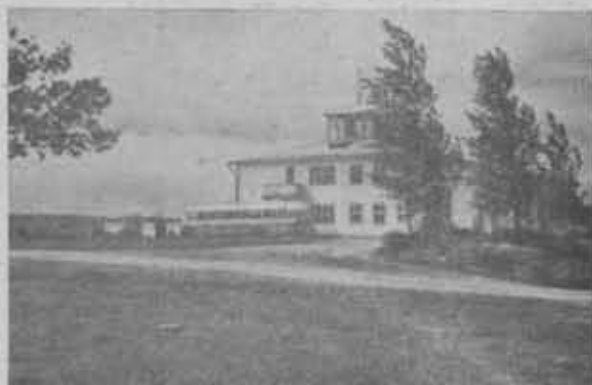
Tom ze zbiorów P. T. K. Schronisko P. T. K. nad Wigrami